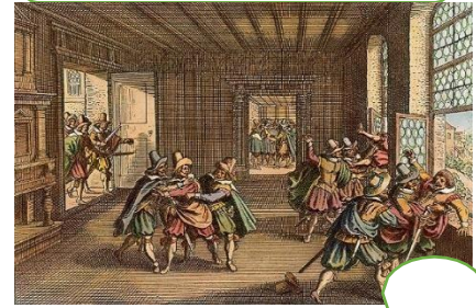
Guerra de los 30 años