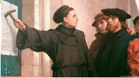
Criticas de Martin Lutero