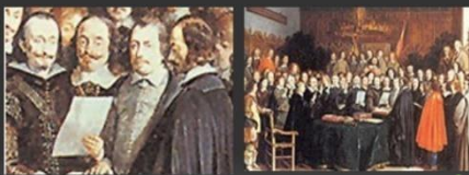
LA PAZ DE WESTFALIA