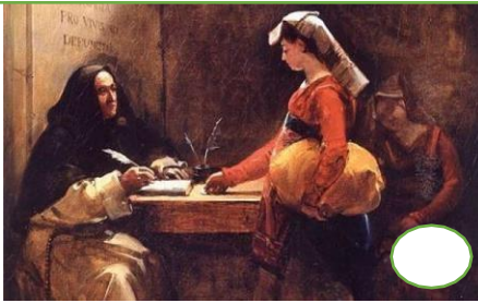
Ventas de indulgencias